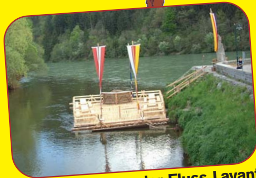
In Lavamünd, wo der Fluss Lavant in die Drau mündet kann man auf dem Floß bis Slowenien fahren.