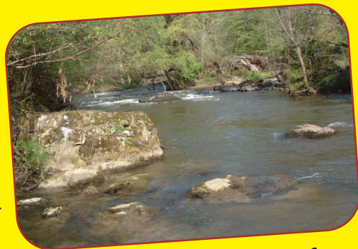
Die Lavant bei Ettendorf