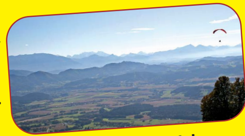
Blick ins Lavanttal