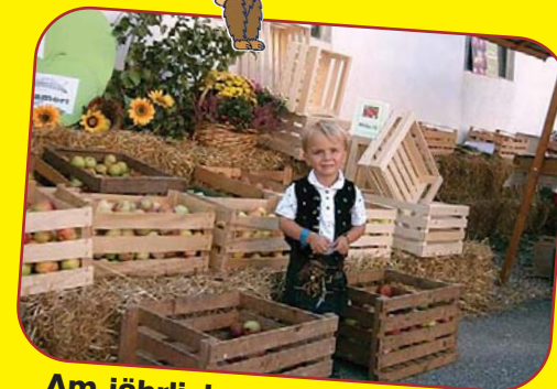
Am jährlichen Apfelfest in St. Georgen gibt es nach der Apfelernte Ende September, den größten Kärntner Apfelmarkt.