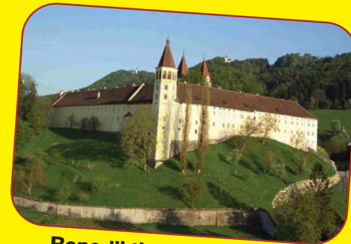
Benediktinerstift St. Paul